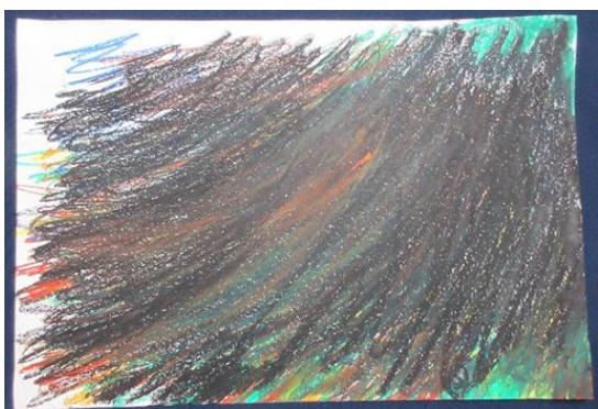
「涙くんさようなら」 町 研汰郎