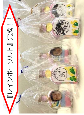
『レインボースォルト』完成！！