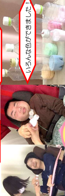
いろんな色ができました！