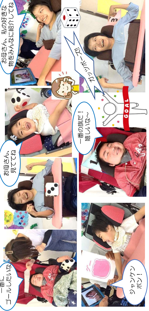
一番にゴールしたいな

6月13日、ご自宅ともみじをオンラインでつないで参観日を行いました。今回は「すごろく」を行い、ご家族参加型の活動内容としてご家族にも一緒に楽しんで頂けるように工夫しました。利用者さんとご家族は離れて過ごしていても『心は一つ』気持ちが続いていました！