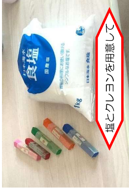
塩とクレヨンを用意して

父の日のプレゼントとして、塩をカラフルに色づけしてボトルに入れて『レインボースォルト』を作りました。お父さんの似顔絵とお花を描いたラベルを付けたら完成です。塩になかなか色がつかず、空き時間にもみんなが振って作りました！みんな大好きなお父さんの喜ぶ顔を思い描きながら制作に励みました。お父さん、喜んでくれたかな？